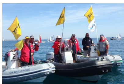
La CIP optimist au Cap d'Agde du 18 au 24 avril