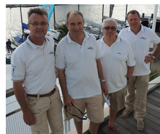
Les Voiles de Saint Barth du 13 au 18 avril (vidéo du Jour 3 en ctrl + clic sur l'image)