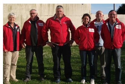
La Solo Maitre Coq du 17 au 26 avril