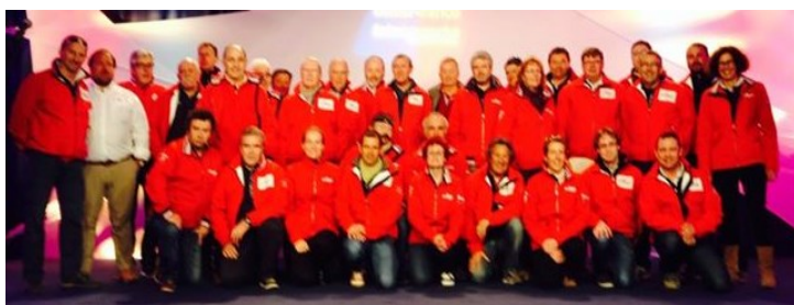
Le SPI OUEST France du 2 au 4 avril